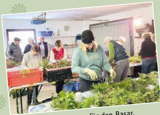
Bei den Vorbereitungen für den Basar.

Schon seit Jahrzehnten basteln die Mitglieder des Frauenbundes Niederviehbach Adventskränze. Mit dem Erlös wurde jedes Jahr die Elterninitiative Krebskranker Kinder in München unterstützt. Heuer fand eine Neuauflage des Weihnachtsbasars im Pfarrheim statt. Die Mitglieder des Frauenbundes dankten den Besitzern der Christbaumplantage Manger-Nutolo aus Aunkofen für die gespendeten Daxen, den Kuchenbäckerinnen und Heidi Herzog für die Unterstützung.