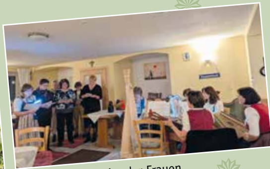
Die Weihnachtsfeier der Frauen.

Schon seit Jahrzehnten basteln die Mitglieder des Frauenbundes Niederviehbach Adventskränze. Mit dem Erlös wurde jedes Jahr die Elterninitiative Krebskranker Kinder in München unterstützt. Heuer fand eine Neuauflage des Weihnachtsbasars im Pfarrheim statt. Die Mitglieder des Frauenbundes dankten den Besitzern der Christbaumplantage Manger-Nutolo aus Aunkofen für die gespendeten Daxen, den Kuchenbäckerinnen und Heidi Herzog für die Unterstützung.