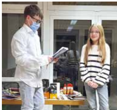
Der Sketch „beim Zahnarzt“.